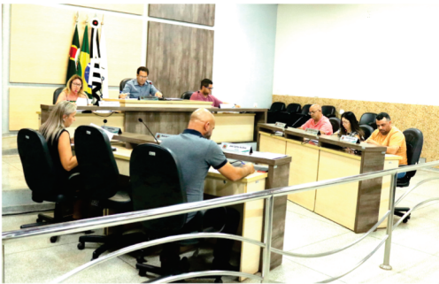
Por Ailton Silva Jornalista